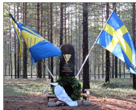
1:a helikopterskvadronens minnessten över omkomna kamrater är placerad i en skogsglänta intill hangar 86.

Mats Hällefors, 1. helikopterskvadronen Luleå