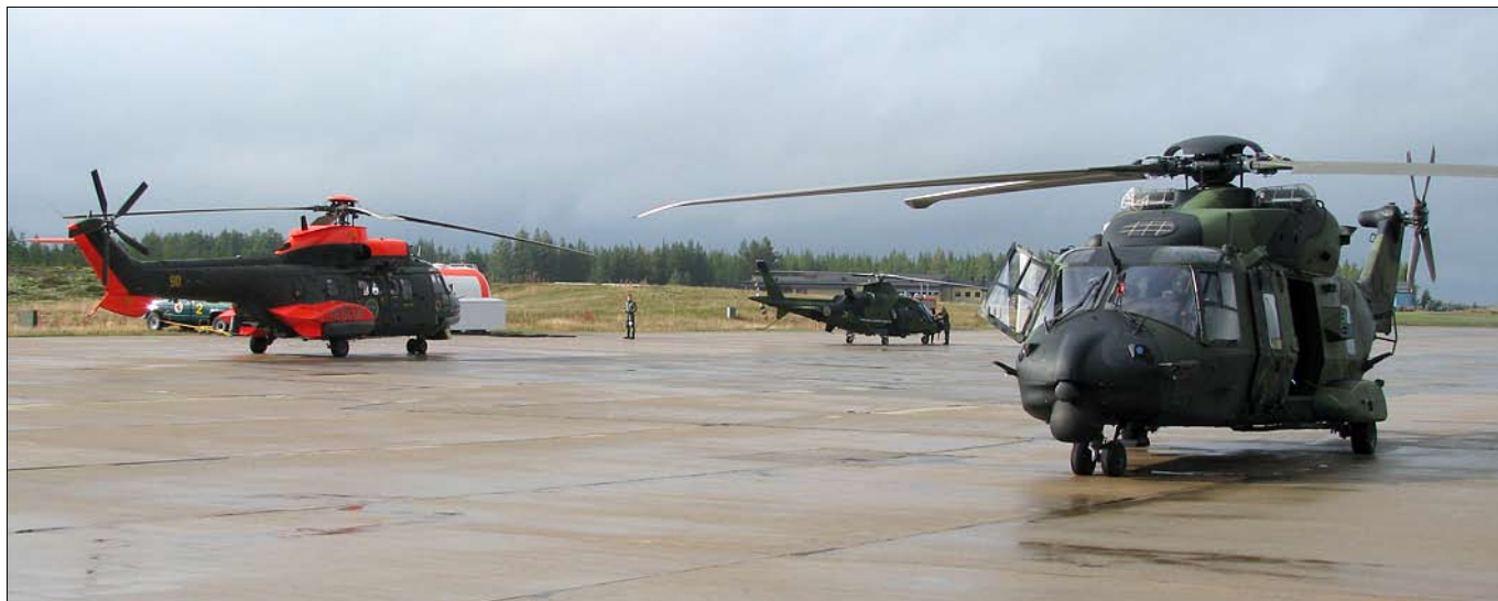
Från vänster Helikopter 10, i mitten det senaste tillskottet i Försvarmakten – helikopter 15 och längst till höger och närmast i bild den finska NH90.