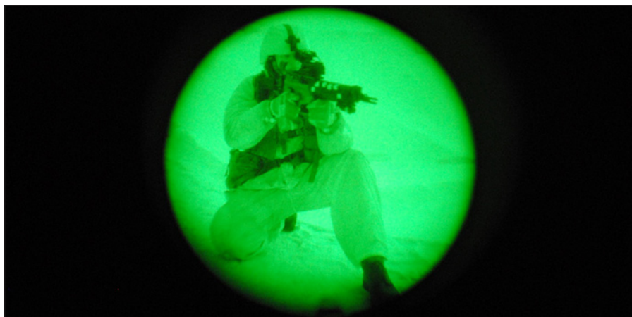
Sensorn förstärker ljuset cirka sextio tusen gånger.