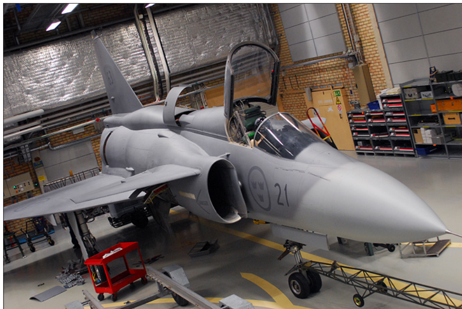
Tisdagen den 24 februari eskorteras flygplanet av polis på vägen fram till Biltema.